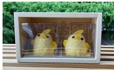
※ぴよりんとのセット販売